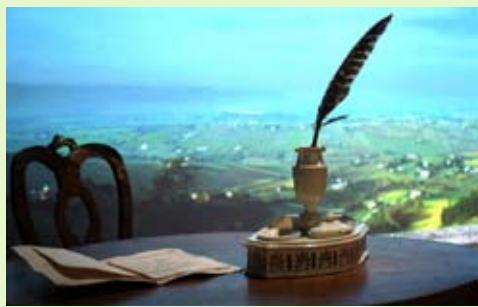
CAGLIARI, 30 settembre 1818